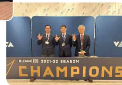
選手のメディカルチェック等も担当

プロバスケットボールクラブ、長崎ヴェルカのメディカルサポートを2022年B3参入から行っており、現在も複数の医師がチームドクターとして活動しています。私も長らくバスケットボール審判活動をしたバスケットボール協会医学委員である縁もあり、チームドクターの一人として活動しています。ホームゲームでの会場ドクターはもちろんです。選手の怪我や下部組織の選手の相談まで幅広く相談に乗りつつ、診断治療をメディカルスタッフの方と相談しながら行っています。また、小学校から高校・一般の大会における会場ドクターとしての地域の活動も並行して行っています。